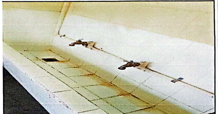
Sustitucion de azulejo