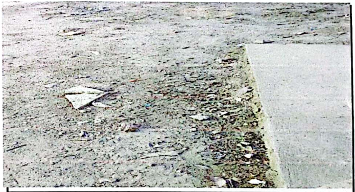
Mejoramiento de plancha de concreto de patio