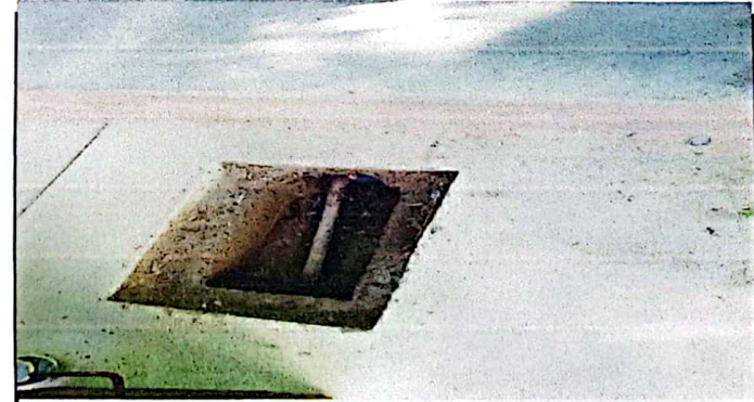
Reparacion de red de agua potable

Observación: Si es necesario se pueden agregar hojas adicionales, especificando el número de hojas.