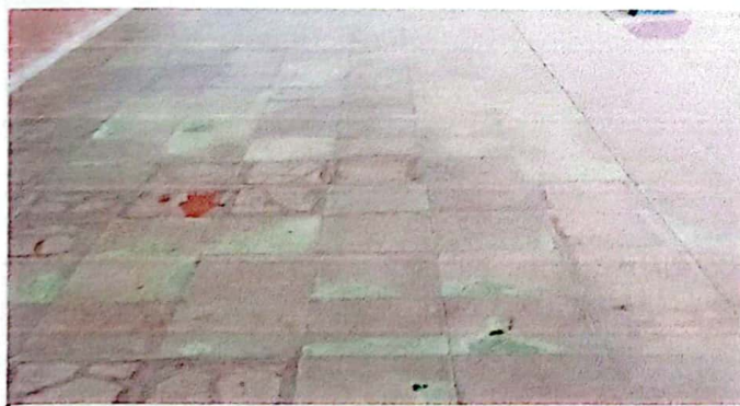
Sustitucion de piso ceramico