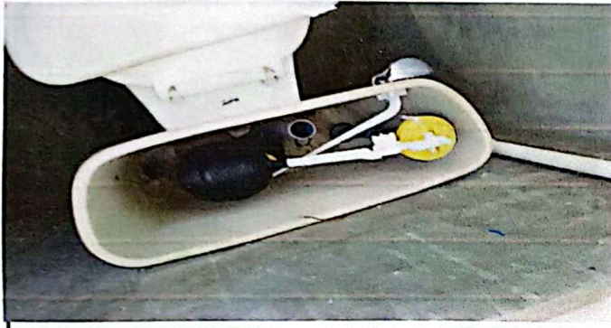
Sustitucion de Inodoro