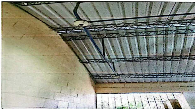
Reparacion de sistema electrico (cable, focos, ducto electrico y accesorios)